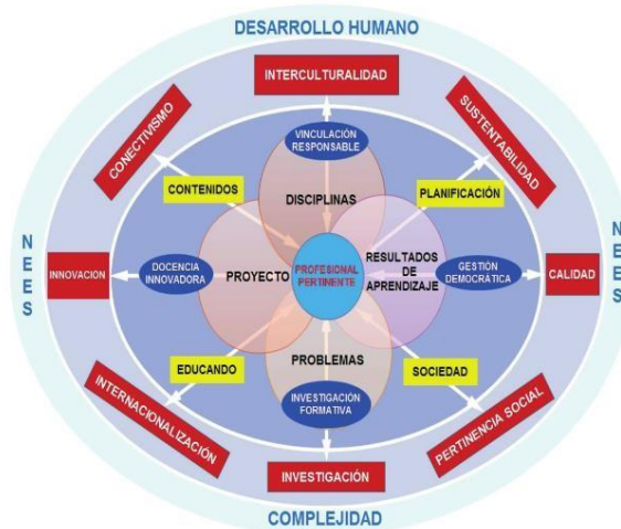
Figura 1. Esquema Integrado del Modelo Educativo Fuente:

estas tensiones deben conciliarse en nuevas fuerzas poderosas para el crecimiento y el desarrollo. Al final, este patrón académico converge en un currículo integrado por resultados de aprendizaje, que se apalanca didácticamente en la enseñanza para la comprensión, el aprendizaje basado en problemas, el modelo por investigación y los proyectos de emprendimiento. (Modelo Educativo, UTN, 2013).